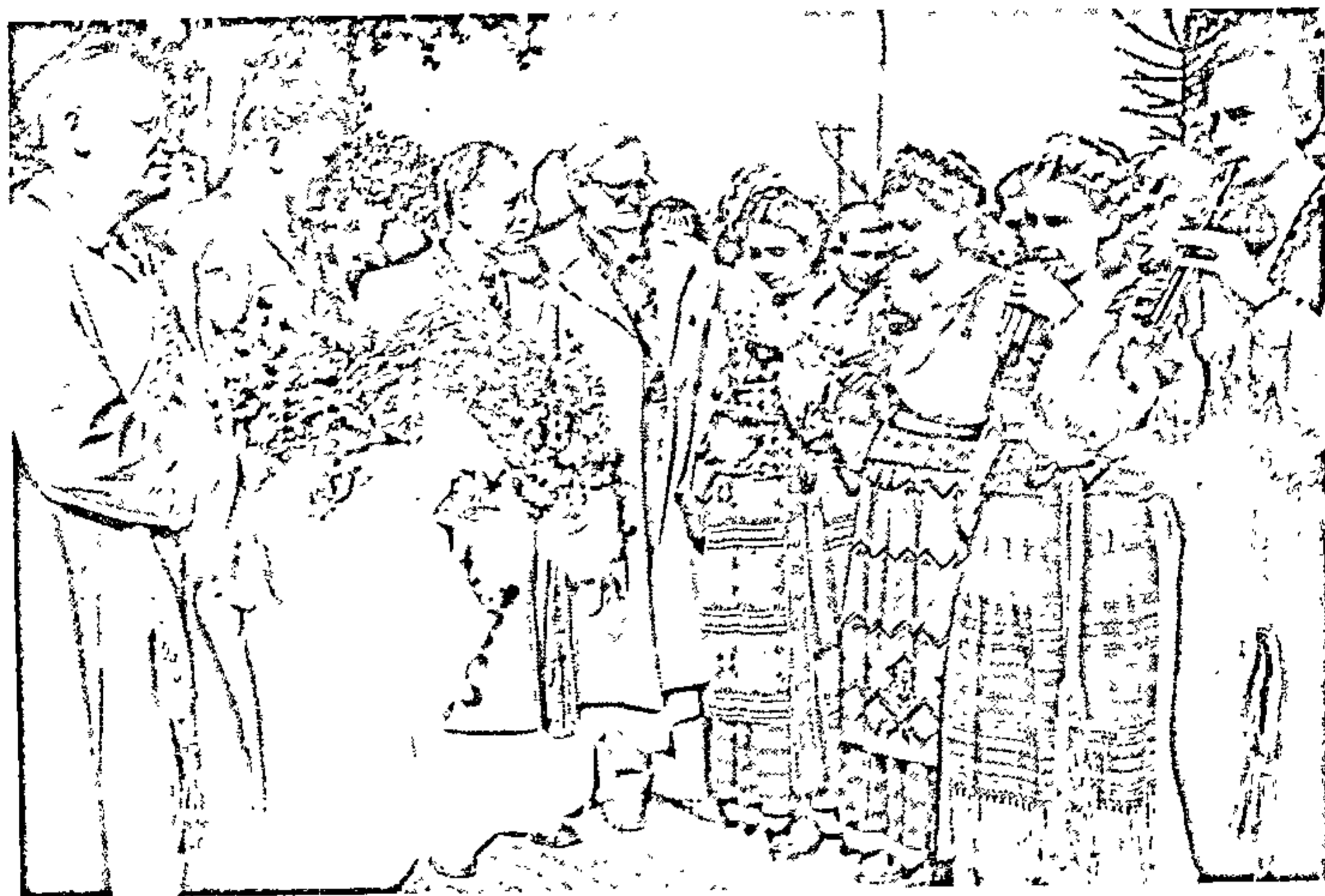
Пятрусь Броўка, Максім Танк, Пятро Глебка, Антанас Венцлава на Дэкадзе беларускай літаратуры ў Літве. 1956 г.