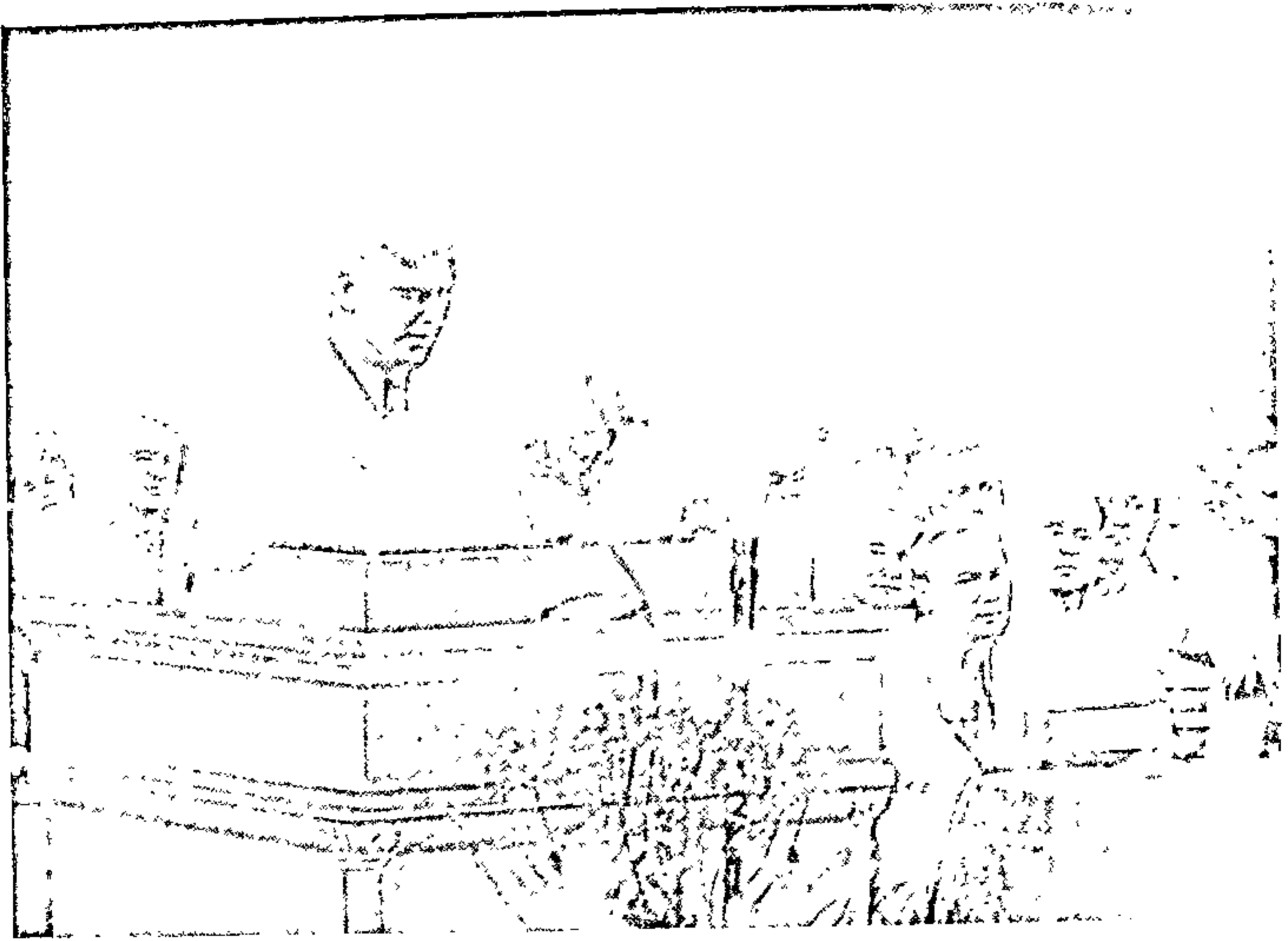
На адкрыцці Дэкады беларускай літаратуры і мастацтва ў Маскве. 1955 г.