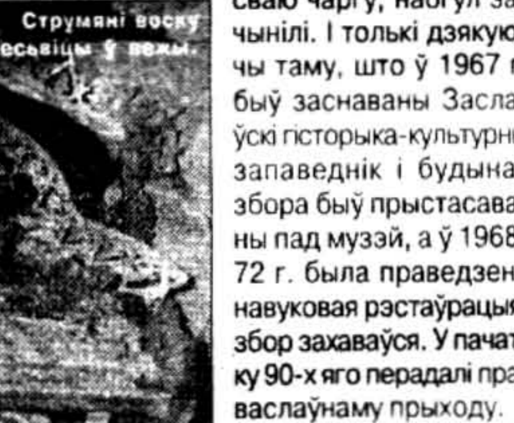
Струмяні воску на лаваскы ў вогні

Вежа збора была ня толькі выдатнай назіральнай пляцоўкай, але і мела традыцыйную для беларускага замка-