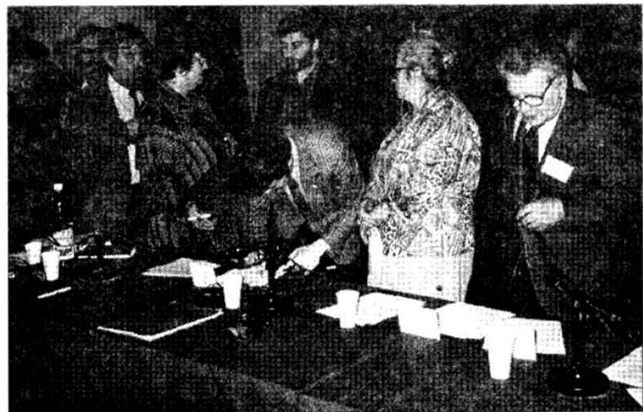
Чарга да падпісаньня рэзалюцыі канфэрэнцыі ў справе Беларусі

У гэтым пераконвае рэакцыя грамадзянаў нашага рэгіёну. Першым, хто адразу ж падыйшоў да нас і