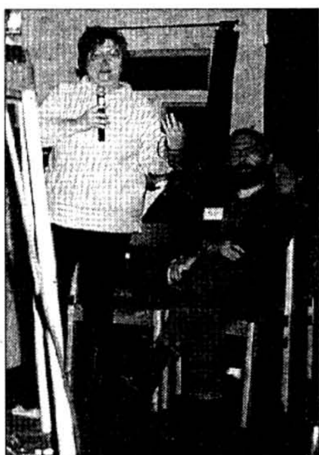
Выступае Пітрुшка Шуштрава — намесьнік міністра ўнутраных справаў у першым дэмакратычным урадзе Чэхіі, адзін з аўтараў чэскага закона аб лустрацыі.