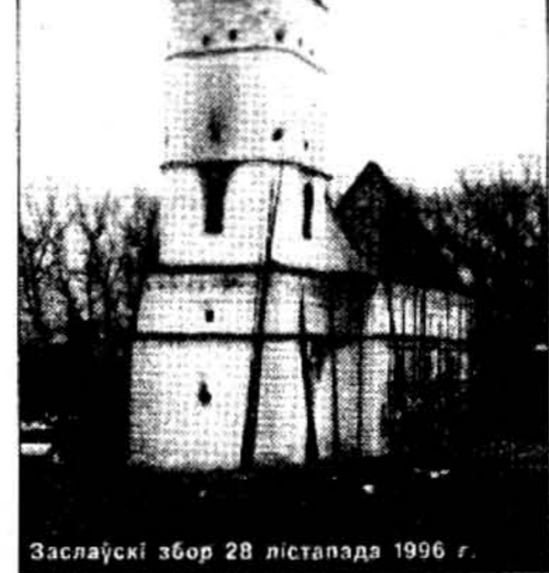
Заслаўскі збор 28 лістапада 1996 г.