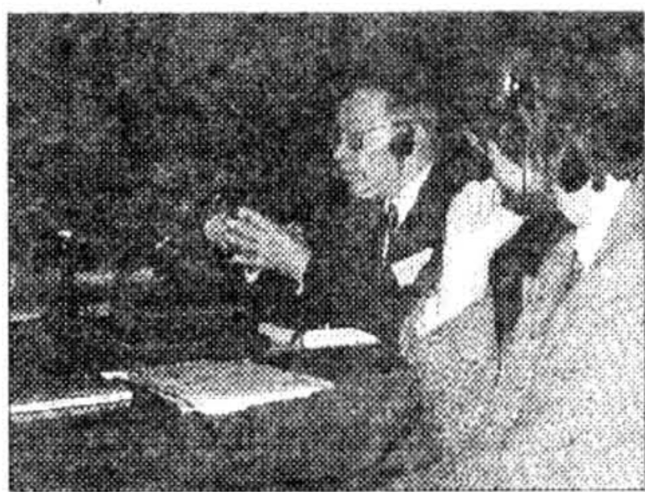
Гра Беларусь гаворыць Аляксандар Гінзбург

Сеньня ў Польшчы пачалі зьяўляцца ня толькі навіны зь Беларусі, але й спробы аналітыкі. Самы сьвежы прыклад — эсэ прафэсара Ягелонскага ўнівэрсытэту Ўладзімера Паўлючыка «Рускія шляхі» ў апошняй «Ролітусу». Менавіта рускія, бо гутарка ідзе пра параўнаньне ўкраінскага ды беларускага нацыянальнага этасу. Лёзунг артыкула — Беларусь ня мае традыцыяў і герояў, якіх Украіна мае празмерна. Паводле думкі аўтара, ідэя ўкраінскай нацыі нарадзілася ў XIX ст. з духовасьці й гістарычнага досьведу ўкраінскага праваслаўнага сялянства й казацтва. Ідэя ж беларускай нацыі нарадзілася тым самым часам з духовага й гістарычнага досьведу «польска-беларускай крэсовай шляхты й зьяўляецца ў дачыненні да народа зьнешнім фэномэнам».