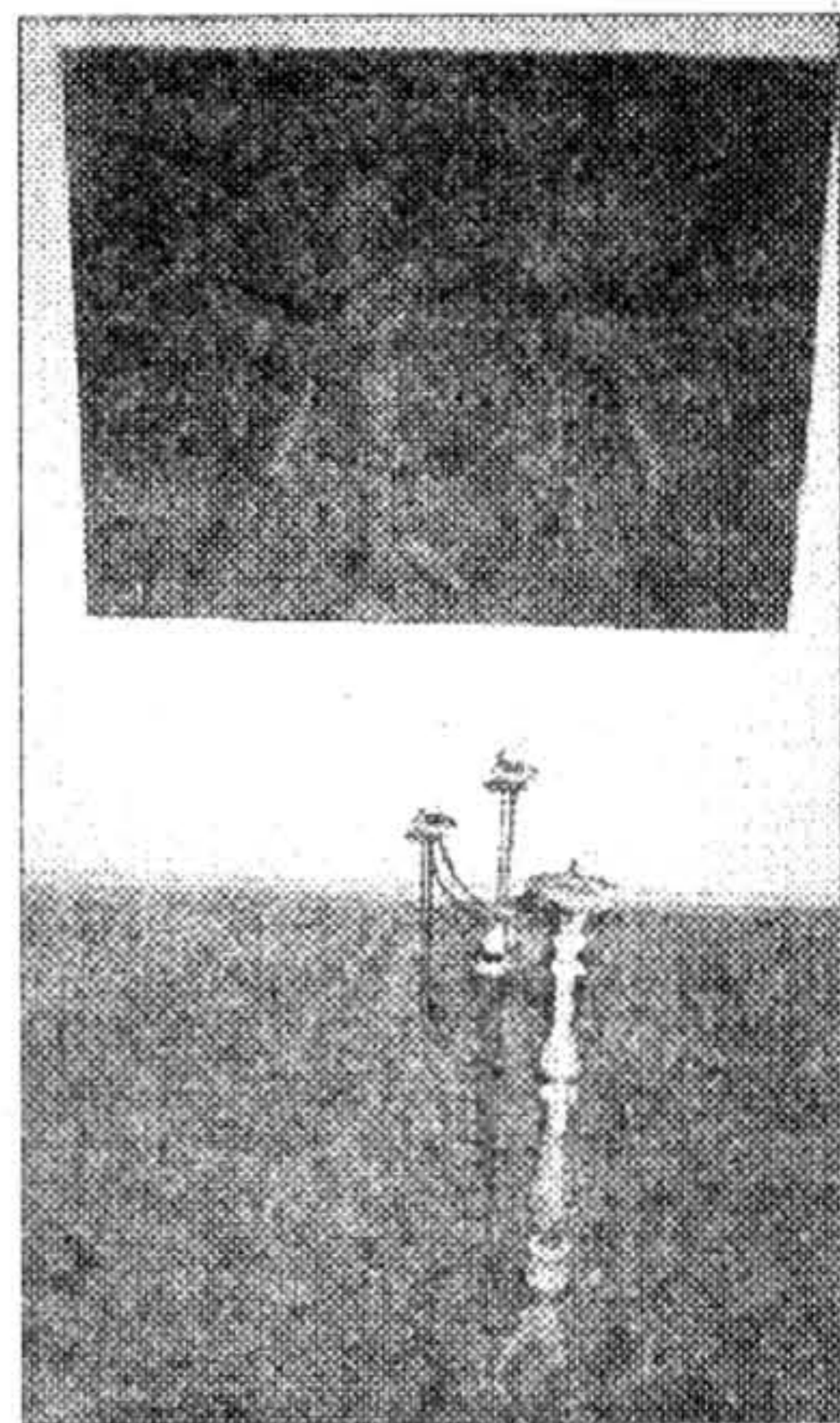
«Сенбіт і касці». Да канфэрэнцыі было прымеркаванае адарваньне выславь апазыцыйнага мастацтва 30-х гадоў. Сеньня ў Польшчы ўжо так не маюць: гэта ўжо гісторыя мастацтва.

Крыху нечаканай для беларуса можа стаць вялікая ўвага да беларускай сытуацыі ў вугорцаў. Гэтая ўвага нараджаецца з пачуцьця салідарнасьці. Вугорцы, якія перажылі 1956 год, асабліва чуйна рэагуюць на прагу іншых народаў да самавызначэньня. У Падкове Лесьні жыве былы пасол Вугоршчыны ў Польшчы й Беларусі Акаш Энгельмаер. Пасьля прыходу да