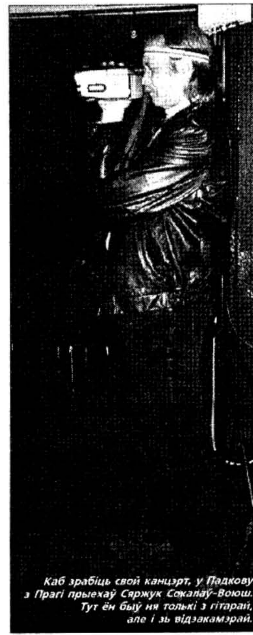
Каб зрабіць свой канцэрт, у Падкову з Прагі прыехаў Сэржук Сожэлаў-Воюш. Тут ён быў ня толькі з гітарай, але і зь відэакамерай.