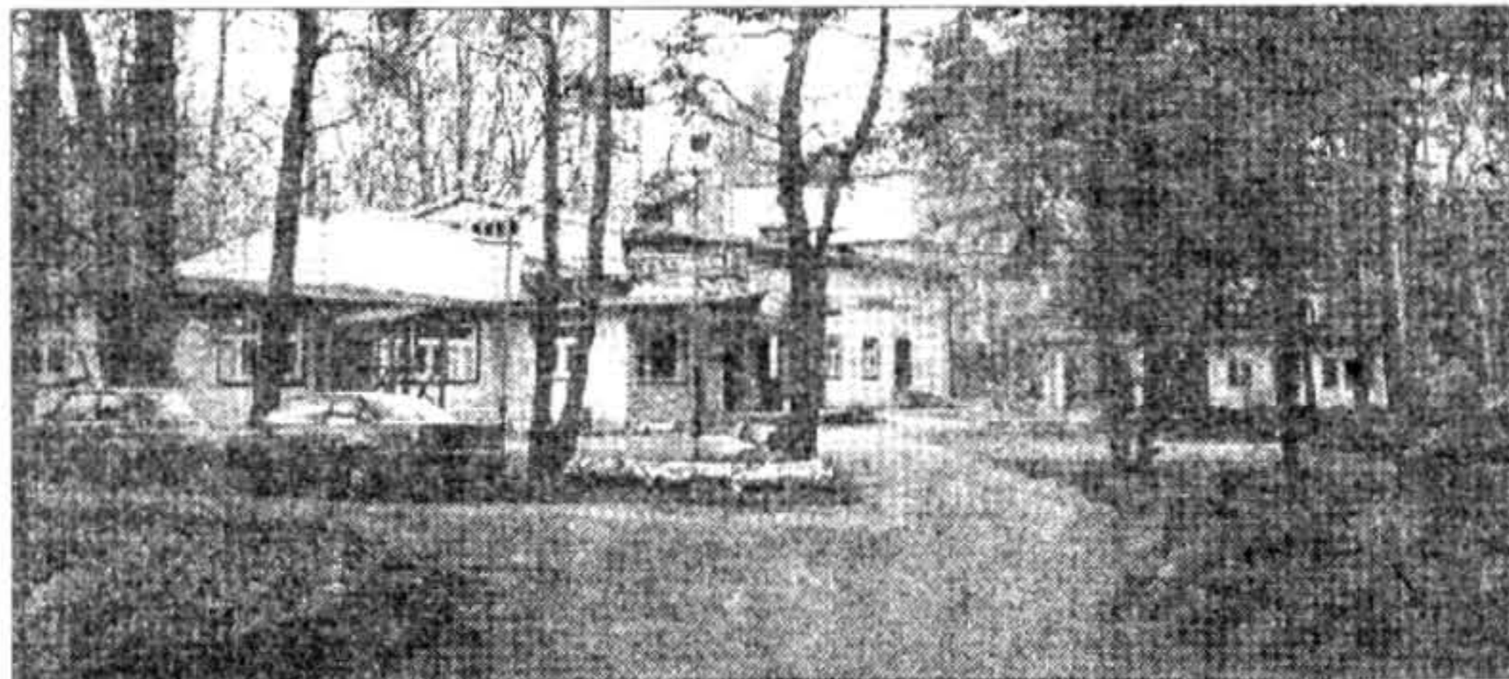
«Коло Подковы» — асярдак, дзе адбывалася канфэрэнцыя. Усіх Падкова Лесьня накардае парк.

Гэта цікавыя тэзы для пачатку дыскусіі. Між тым, варта заўважыць, што гэтая новая польская інтэлектуальная традыцыя зусім ня ўлічвае сёньняшнія рэаліі урбаністычнае Беларусі й існаваньне ўжо ўласна беларускай нацыянальнай традыцыі.