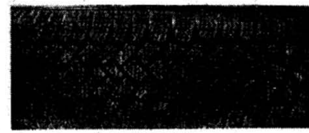
Continental TS 760-2