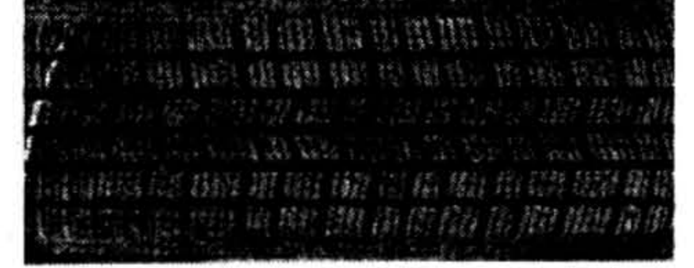
Michelin XM + S - Alpin

Калі Вы ўзмку жадаеце пачувацца ў аўтамабіле надзейна, то не забудзьцеся набыць шыны зь зімовым малюнкам пратэктара. Пры выбары шынаў Вам дапамогуць вынікі тэставаньня, праведзенага нямецкай выпрабавальнай арганізацыяй Штыфтунг Варэнтэст. Тэставалася 27 узораў аўтапакрываак зь зімовым малюнкам пратэктара 175/70R13. СТАР. 6