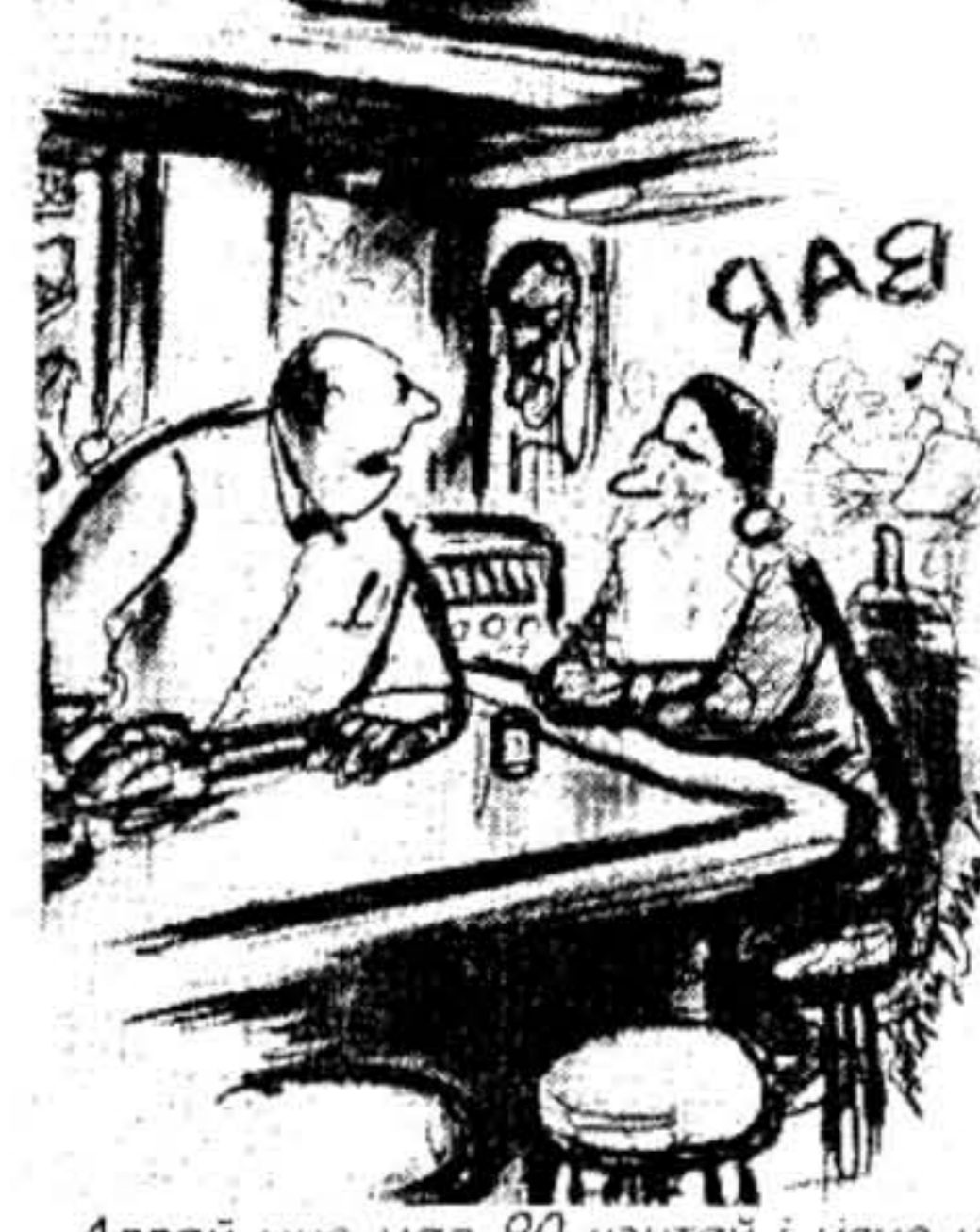
- Ададзі мне мае 90 цэнтаў і мяне не шквоўце, што ты пакладзеш пад маю елку.

№24. Здароўе: Перш чым зьявіцца да лекара. Як кінуць паліць (№Ф. №4); Прыродныя атруты (№Ф. №10); Атлетычныя клубы, шэйлінг, аэробіка, тэнісныя корты (№Ф. №18); Комплексная ацэнка зобруджвання асяроддзья Менску і вобласці (№Ф. №19); Тэст: асыпрын (№Ф. № 22); Небаспечныя лекі (№Ф. № 22); Пра шкоду пасіюнаго паленьня (№Ф. № 22); Без дытты не абясыцца (№Ф. № 23); Перш чым купіць цацку, панахойце! (№Ф. № 23). Гаспадарка: Газ у нашым доме. Як чыстае цэпцікі на вопратцы (№Ф. №5); ЖЭС. Ремонт жылта. Пункты прыёму замовы на будоўніча-рамонтныя працы (№Ф. №6); Як мыць і чысціць посуд. Калі залілі кватэру... (№Ф. №8); Як пабудоваць садовы домик. Дом і дзялянка (№Ф. №9). Прас-рэліз: Сьвет за тыдзень (№Ф. №28). Грамафон: Старонка вершаванага радка (№Ф. №6, 8, 11, 17, 19, 20, 24, 25, 26). Харчаваньне: Якую гарботу мы п'ем. Пра часнык (№Ф. №7); Бары, рэстараны, кавярні Менску (№Ф. №15). Спорт: Вынікі спаборніцтваў і інш. (№Ф. №7, 9, 19). Бібліятэка: Новыя паступленні ў кнігарні. Рэцэнзіі (№Ф. №9, 10, 11, 15, 16, 18-27). За мяжой: Хто такія ньюбэры; Ліставаньне з навучальнымі ўстановамі ЗША (№Ф. №17). Беларусь і свет: Індзейцы ў Беларусі (№Ф. № 21). Адвкат: Ахова праваў чалавека. Міжнародная Аміністра (№Ф. №17). Псыхалогія: Сьцюдэр чалавечнага жыцця пішоўца і яшчэ ў дзяцнстве (№Ф. №24); Калі Ён купіць, усе гэтыя залезы ў воду і пляскоцца (№Ф. №24). Чалавек: Пра цяжкае жыццё і лёгкую смерць; Дзённік без канца. І. Магусевіч Тэст: самая простая памяць (№Ф. №27).