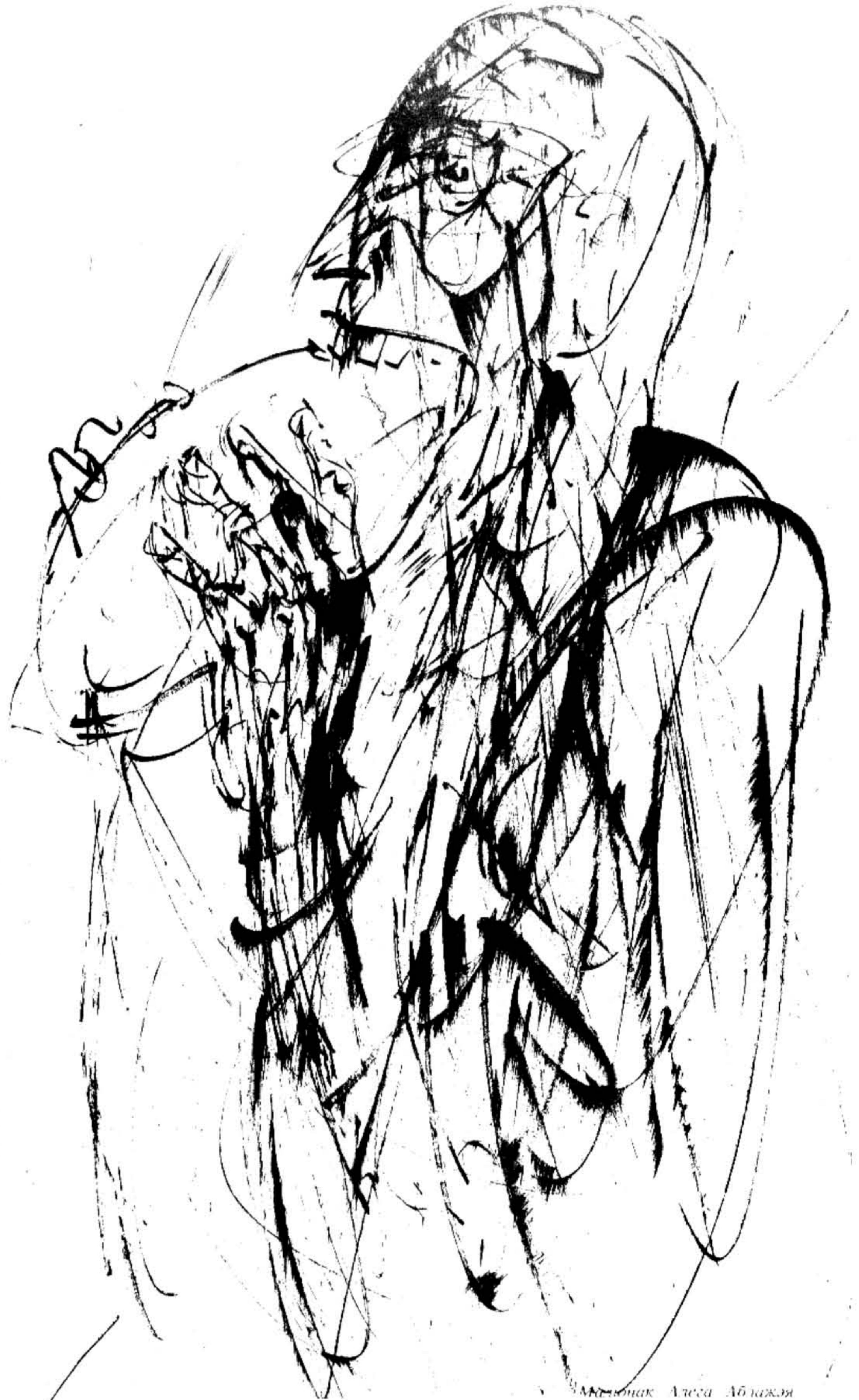
Малюнак Алеся Аблажы

Выглядаў Шавура будзённа й шэра. Сівы, загарэлы па-сялянску, у старым пінжаку, надзетым на майку. Нагавіцы ў зямлі. Галёшы на босых нагах. І ўся будзённасьць і някідкасьць