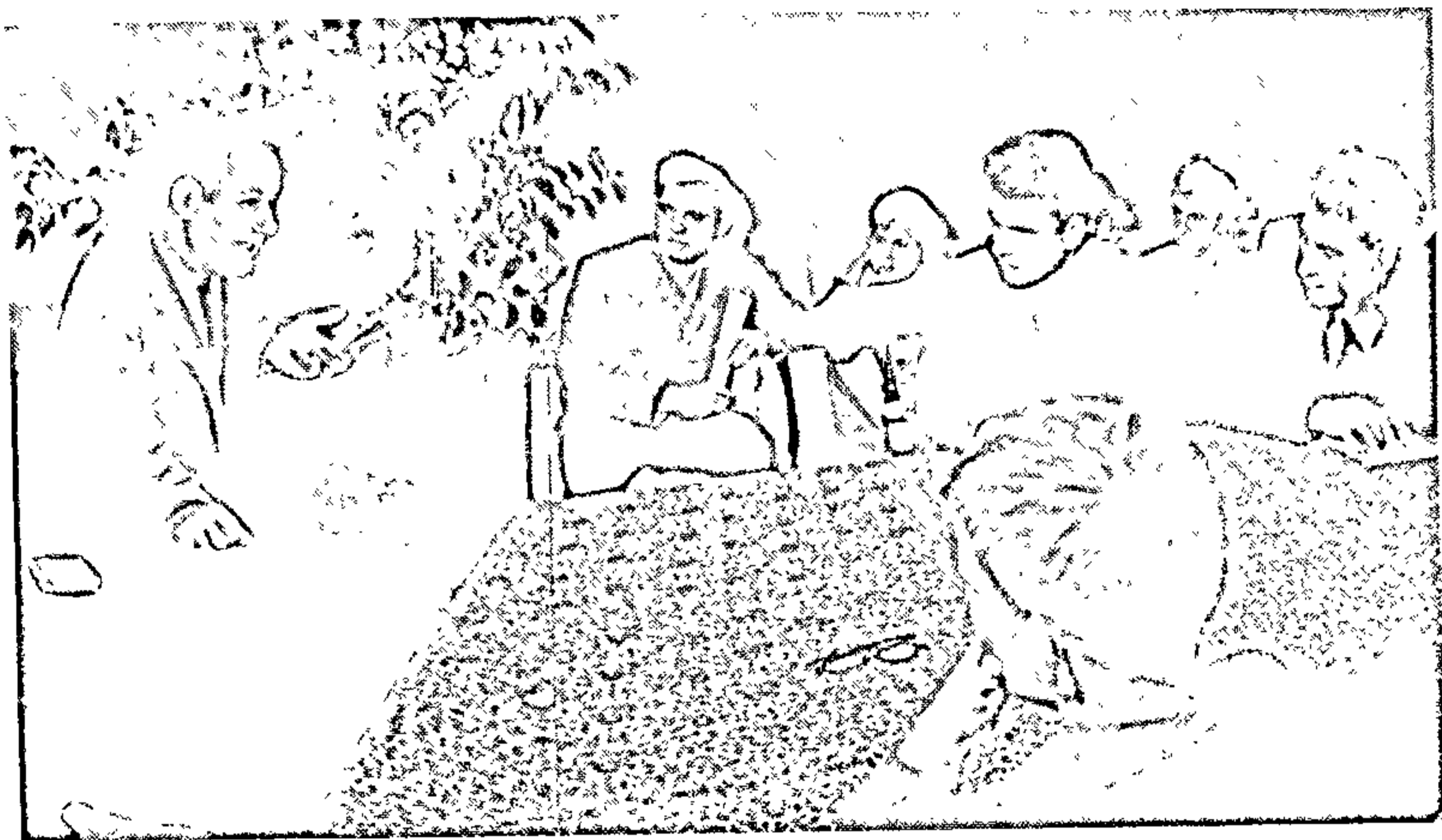
Іван Мележ дзеліцца вопытам з маладымі пісьменнікамі на нарадзе ў Каралішчавічах. 1969