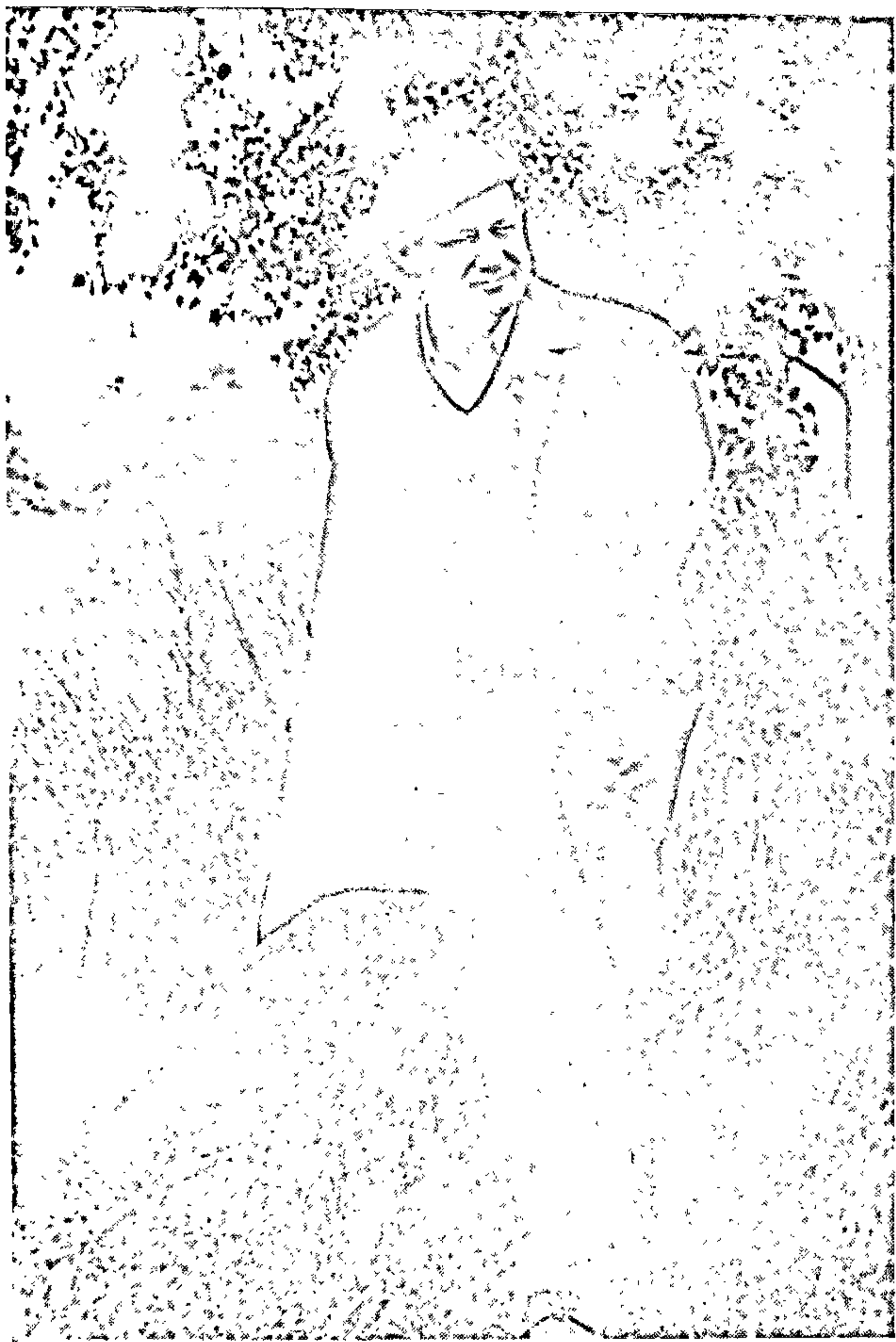
Іван Мележ у родных мясцінах. 1970