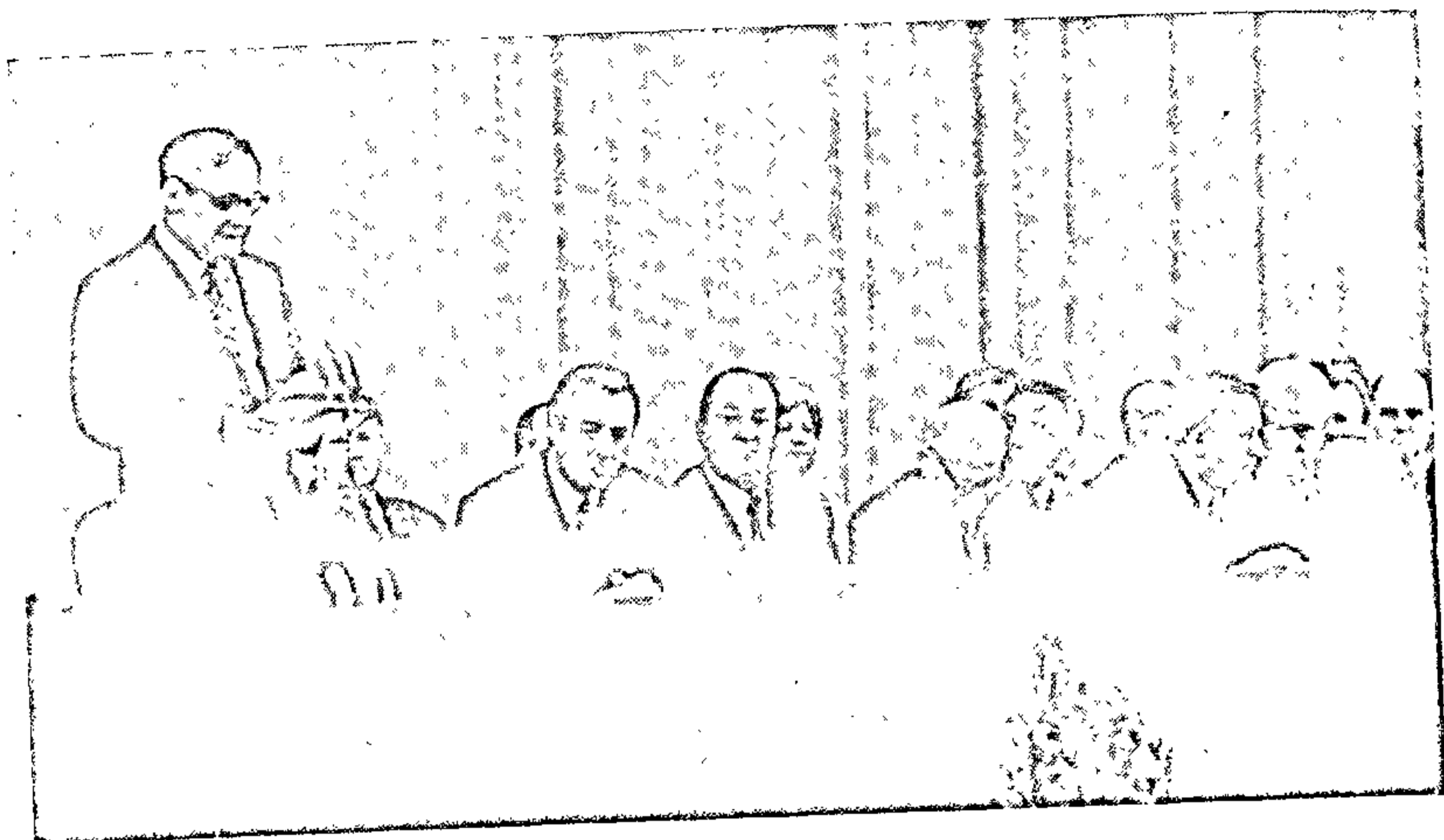
Выступленне Івана Мележа на юбілейным вечары, прысвечаным 70-годдзю з дня нараджэння Міхаіла Шолахава. 1975