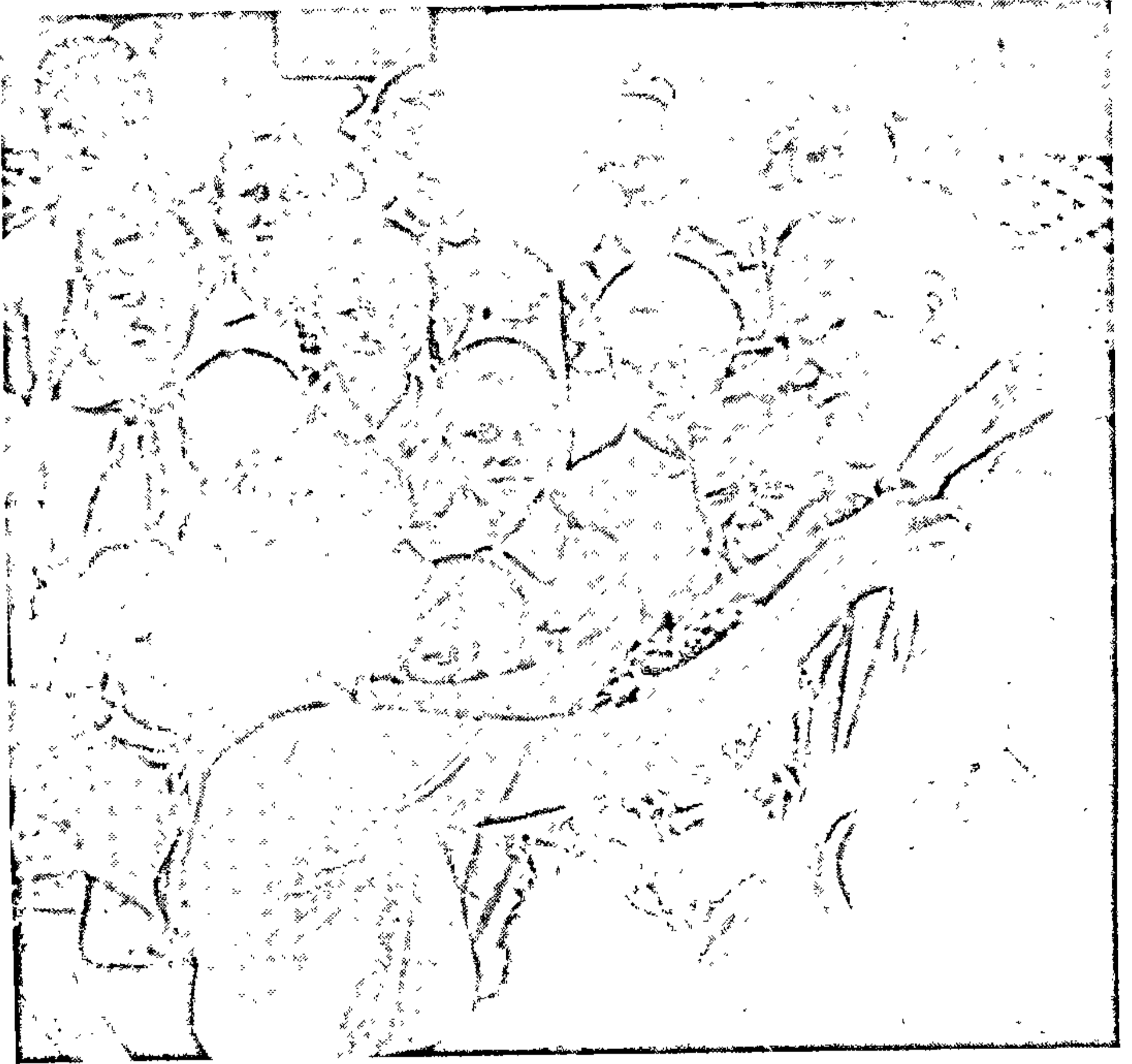
Іван Мележ — ганаровы піянер роднай вёскі. 1969